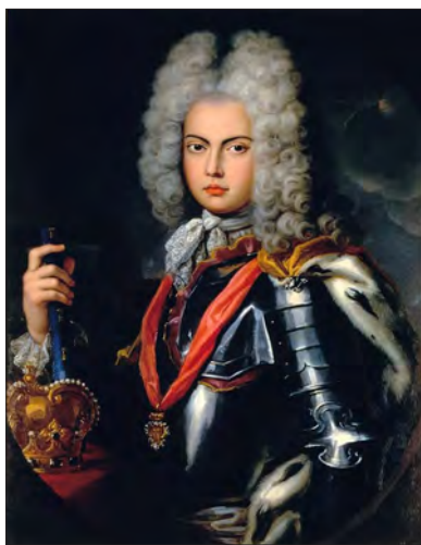
D. João V por Pompeo Batoni